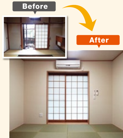
和室(旧間6畳)に 6畳タイプの耐震シェルターを設置