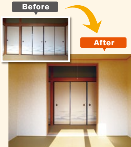
和室(8畳)に 6畳タイプの耐震シェルターを設置